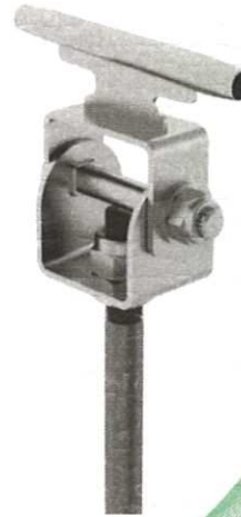
Bild 2: Anschlageinrichtung mit Seilführungskomponente (Zwischenhalter)