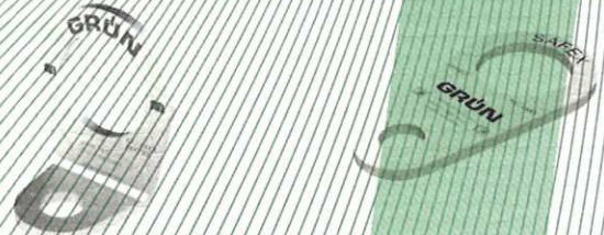
Bild 4: Anschlagpunkt SAFEX „Wirbelöse“ und Anschlagpunkt SAFEX "Flach"